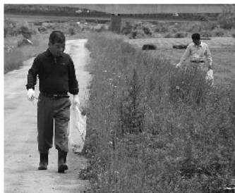
新田次期会長も収穫なし