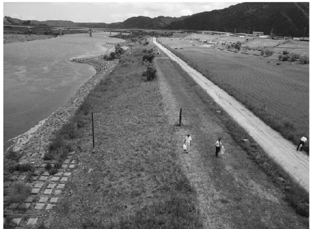
中村ロータリー担当の美化ゾーン全景