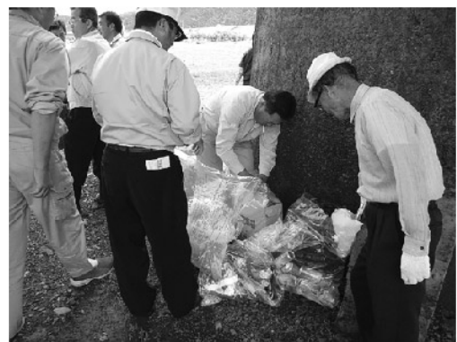
集められたゴミより、会員の食べた弁当の方が多くな