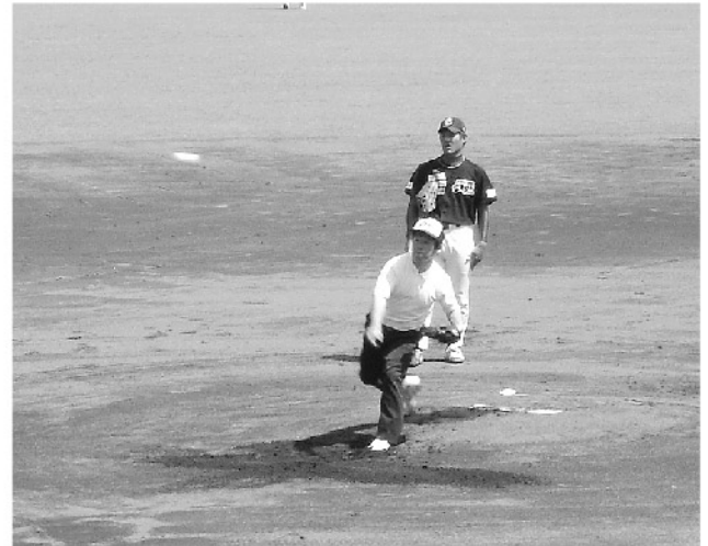
5月26日、四万十スタジアムにて開催された四国アイランドリーグの始球式でナイスピッチングの浦会員