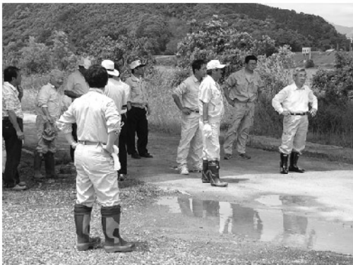
前夜の雨ため、ゴム長など完全武装のメンバーも

今期最後の美化ゾーン例会が、くろ鉄橋から赤鉄橋までの四万十川右岸約700メートルの区間で行われました。