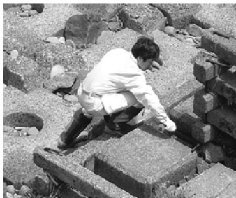
テトラの中まで熱心に探索