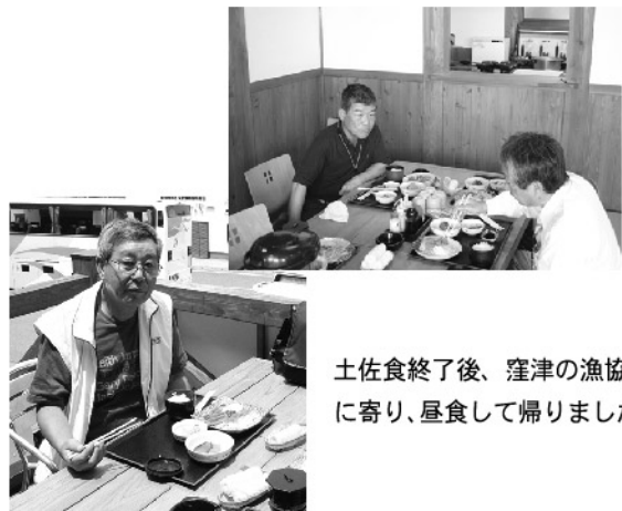
土佐食終了後、窪津の漁協に寄り、昼食して帰りました。