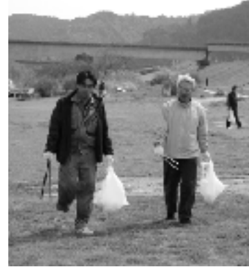
江口会員と黒石会員