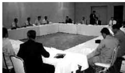
例会終了後クラブ協議会開催