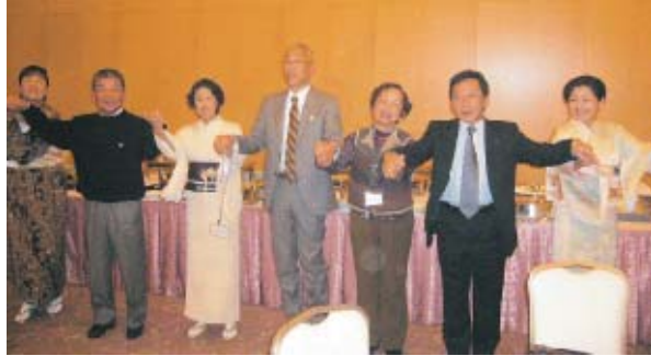
恒例「手に手つないで」でお開きとなりました。