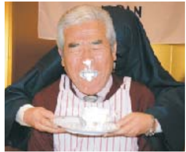
他には流せない写真です・・・申しわけありません