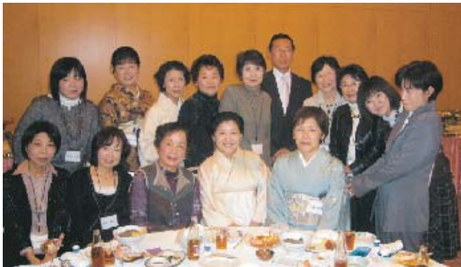
ロータリー活動もご夫人たちのお陰様、と感謝の佐竹会長