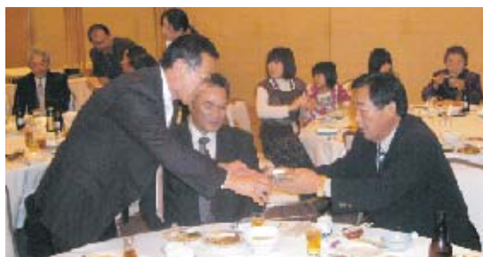
「大杉米山委員長、今年もよろしく！」