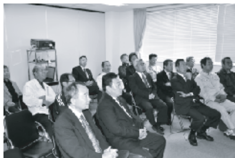
ブリーフィング室で神妙な面持ちで説明を聞く参加者

レーダーサイトで得た情報を司令所に送る通信、司令所からの飛行中の航空機に指示を伝達する。神経系統のような役割を果たしている。一見すると地味だが、これがないと通信が混乱してしまう。防空作戦では重要な役割を果たしており、我々は地味だが誇りを持って仕事をしている。