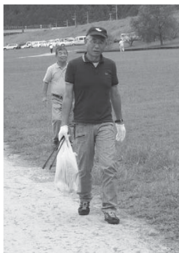
職業柄、カジュアルが似合っ ています