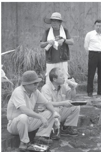
格好だけは本格的！大杉会長エレクト