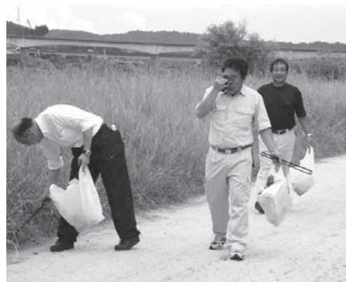
▲ 汗かきの一藤会員も頑張っています！