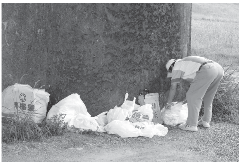
最後まで集ったゴミ袋の処理をしてくれました。さて、私は誰でしょう？