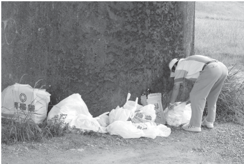
最後に集ったゴミ袋の処理をして終了しました。