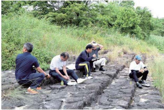
お弁当をいただいた後、清掃活動に