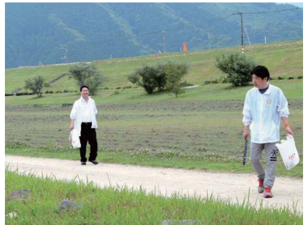
中平会員、横田会員も慣れました