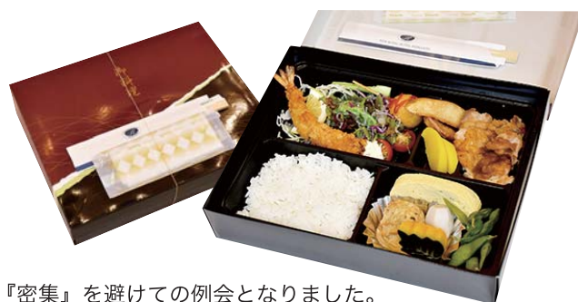
『密集』を避けての例会となりました。 しばらくはこの状態が続くと思いますが よろしくお願いします。