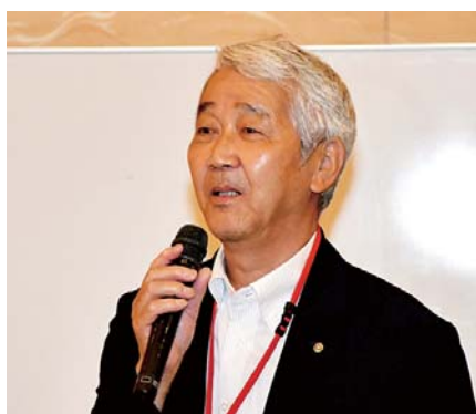
大平高知第II分区ガバナー補佐